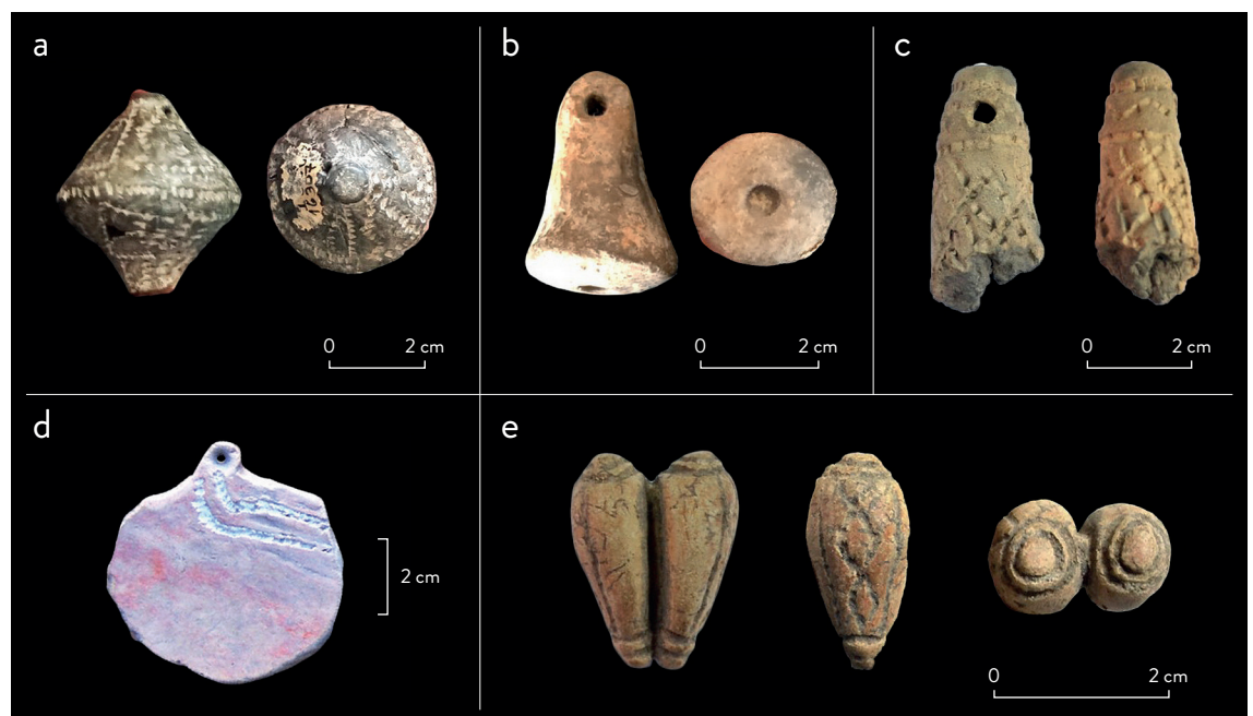
Figura 2. Colgantes de cerámica: a) y b) sitio CGILM, colección Gaspary; c), d) y e) sitio ALM1, colección Ceruti. Figure 2. Ceramic pendants: a) and b) site CGILM, Gaspary collection; c), d) and e) site ALM1, Ceruti collection.