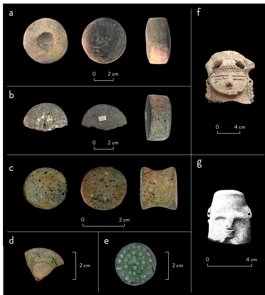
Figura 5. Orejeras: a) sitio ALM1, colección Ceruti; b) sitio LT, colección Serrano; c) sitio PB, colección Ceruti; d) y e) sitio AGI, colección Ceruti. Representaciones con adornos faciales: f) sitio CGILM; g) sitio ALM1 (Serrano 1946: fig. 90) ( a-c , fotografías de Daniel Loponte). Figure 5. Earspools: a) site ALM1, Ceruti collection; b) site LT, Serrano collection; c) site PB, Ceruti collection; d) and e) site AGI, Ceruti collection. Representation with facial ornaments: f) site CGILM; g) site ALM1 (Serrano 1946: fig. 90) ( a-c , photos by Daniel Loponte).

2 cm (N=1), entre 3,2 cm y 3,5 cm (N=2), y entre 4 cm y 4,4 cm (N=3). Contamos con dos casos de apéndices antropomorfos de cerámica con adornos faciales que proceden de CGILM (fig. 5f) y ALM1 (fig. 5g), en el que se observan orificios en el área donde se sitúan las orejas de las figuras, posiblemente atribuibles a la presencia de dichos extensores.