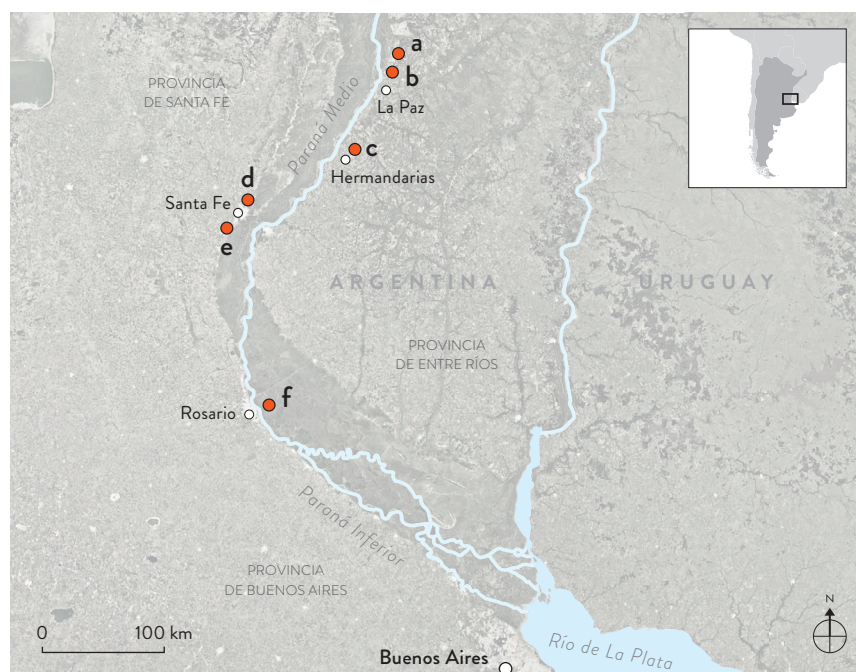
Figura 1. Sitios considerados en este trabajo: a) Arroyo Las Mulas 1; b) Arroyo Arenal 1; c) Piedras Blancas; d) Ángel Gallardo 1; e) Las Tejas; f) Cerro Grande de la isla de Los Marinos. Figure 1. Sites considered in this study: a) Arroyo Las Mulas 1; b) Arroyo Arenal 1; c) Piedras Blancas; d) Ángel Gallardo 1; e) Las Tejas; f) Cerro Grande de la isla de Los Marinos.

de alianza en situaciones de conflicto (Ottalagano 2013). Recientemente, también se discutió el rol de ciertas figuras ornitomorfos como representaciones totémicas (Ottalagano 2023), especialmente aquellas de loros y aves rapaces. La particular distribución espacial y latitudinal que despliega regionalmente la iconografía de ambas clases de aves, podría estar ligada a oposiciones totémicas al interior de un grupo cultural extenso, destinadas a promover la cohesión y la integración social.